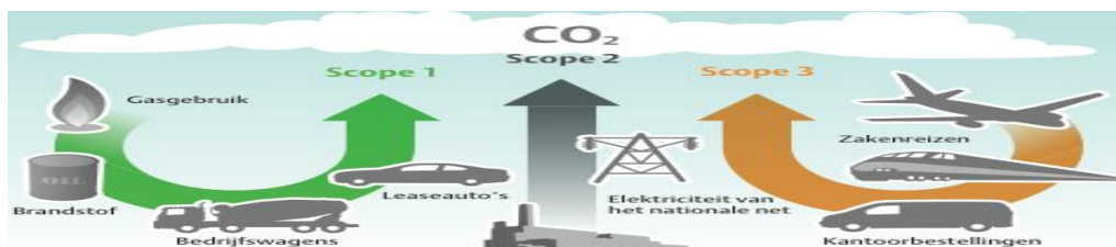
Afbeelding 1: Overzicht CO 2 -scopes

Onderstaande afbeelding onderscheidt de verschillende scopes op basis van de herkomst van het broeikasgas.